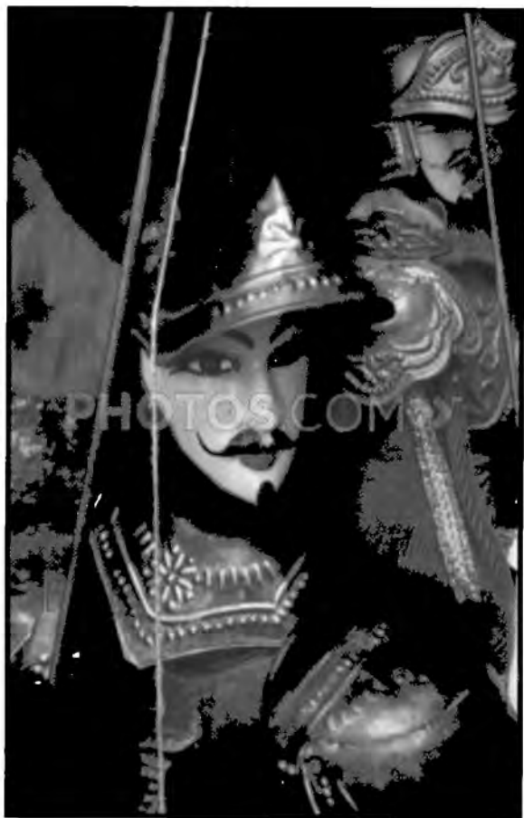
شارمان في لباسه الحربي